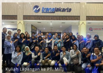
Kuliah Lapangan ke PT. MITJ

Program Studi Magister Transportasi (TR) akan membuka kesempatan bagi mahasiswa sarjana baik dari program studi S1 PWK, S1 AR, maupun program studi lain di luar SAPPK di ITB untuk dapat mengikuti Program Integrasi Sarjana-Magister (PISM). Pada program Magister TR sendiri, mekanisme yang akan dijalankan terbagi menjadi klaster linier, semi-linier (fast-track), dan non-linier. Secara umum, melalui ketiga mekanisme tersebut tidak ada perbedaan signifikan dalam struktur mata kuliah yang diintegrasikan. Mahasiswa akan menempuh 8 semester secara reguler untuk S1, namun sejak semester 5 sudah mengambil mata kuliah S2 hingga semester 8. Pada semester 9 dan 10 mahasiswa mengambil mata kuliah S2 lainnya yang belum diambil dijenjang S1, sehingga dengan mekanisme PISM mahasiswa saat berstatus S1 akan menempuh 4 tahun ditambah 1 tahun S2.