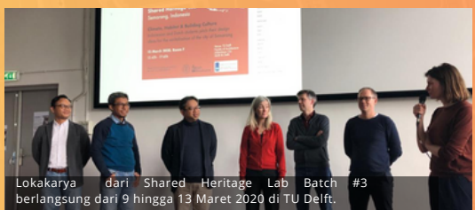
Lokakarya dari Shared Heritage Lab Batch #3 berlangsung dari 9 hingga 13 Maret 2020 di TU Delft.