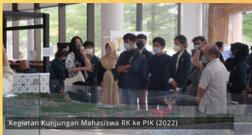
Kegiatan Kunjungan Mahasiswa RK ke PIK (2022)

Program Studi Magister Rancang Kota membuka Program Integrasi Sarjana-Magister (PISM) khusus untuk Program Studi Sarjana Arsitektur (S1 AR) dan Perencanaan Wilayah dan Kota (S1 PWK). Pelaksanaan program integrasi Program Studi Sarjana Arsitektur ataupun PWK dengan Magister Rancang Kota sangat relevan untuk dikembangkan karena adanya peningkatan kebutuhan ahli Rancang Kota di Indonesia. Peningkatan kebutuhan tersebut didasarkan pada adanya program pemindahan Ibu Kota Negara dan juga agenda pembangunan di daerah-daerah terutama area 3T yang diharapkan dapat menggunakan prinsip berkelanjutan. Dengan adanya program ini diharapkan kuantitas dan kualitas lulusan akan turut meningkat.