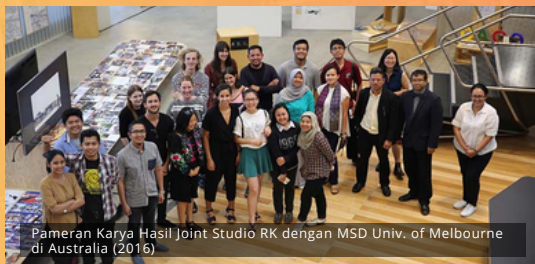
Pameran Karya Hasil Joint Studio RK dengan MSD Univ. of Melbourne di Australia (2016)