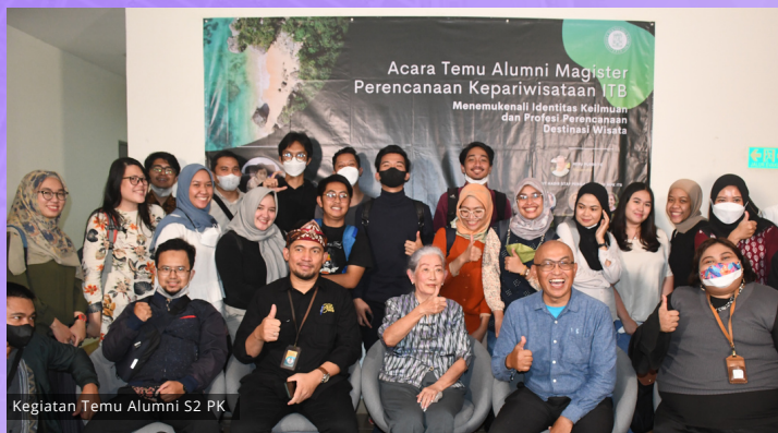
Kegiatan Temu Alumni S2 PK

Program Integrasi Sarjana Magister (PISM) dirancang agar mahasiswa S1 PWK, S1 AR dan S1 Non-SAPPK di ITB, mendapatkan kesempatan untuk melanjutkan ke jenjang studi lebih tinggi pada bidang perencanaan kepariwisataan. Mekanisme yang akan dijalankan terdiri dari klaster linier (bagi mahasiswa S1 PWK), semi linier (bagi mahasiswa S1 AR) dan non-linier (bagi mahasiswa S1 Non-SAPPK). Jumlah sks yang akan dibebankan kepada mahasiswa PISM yaitu 180 sks yang akan ditempuh dalam 5 tahun (4 tahun program sarjana dan 1 tahun program magister).