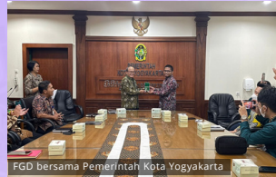
FGD bersama Pemerintah Kota Yogyakarta