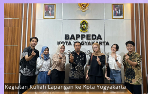
Kegiatan Kuliah Lapangan ke Kota Yogyakarta